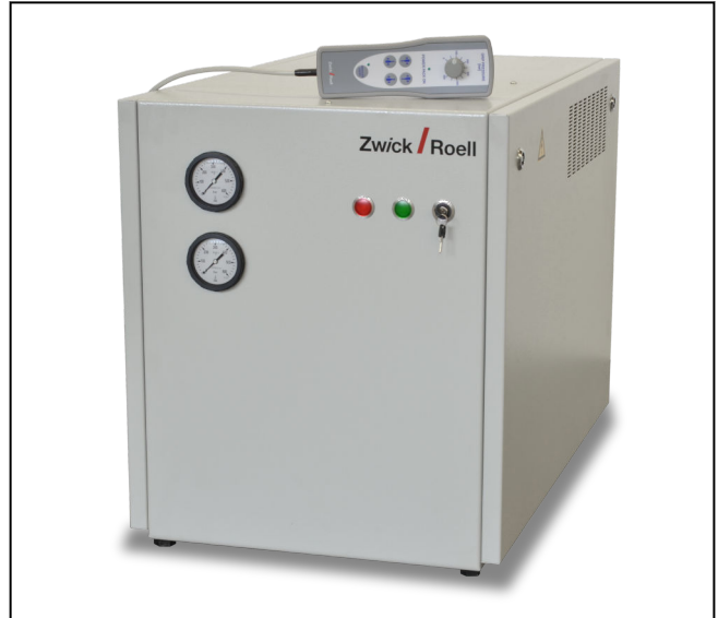
Hydraulik-Aggregat GripControl SA